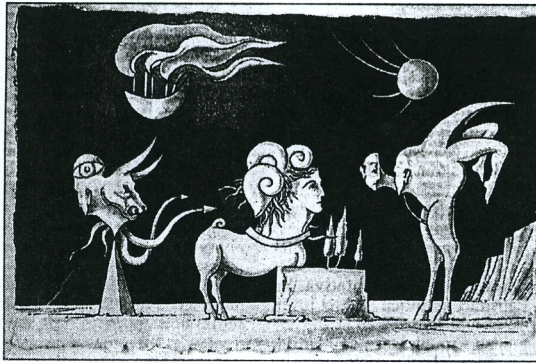
Obra de Cruzeiro Seixas

La exposición sobre el pintor y escritor de origen portugués Cruzeiro Seixas , Amadora 1920, organizada por la Fundación Eugenio Granell en la capital compostelana, comprende un recorrido completo por la trayectoria plástica de este artista desconocido para el gran público pero un exponente clave para el desarrollo del surrealismo. Entroncado con la tradición más pura del dibujo automático, Cruzeiro Seixas construyó a lo largo de los años 30 y 40 un lenguaje figurativo de claros componentes humanos, donde los sueños, los miedos y los fantasmas se disfrazaban de extraños monstruos antropomorfos. El subconsciente juega en la pintura de Seixas un papel tan importante para el arranque de la obra como lo hace su ideario político-ideológico. Claramente comprometido con la izquierda portuguesa, las actividades de este artista estuvieron siempre ligadas al anhelo democrático en el seno de un régimen dictatorial vivido bajo la tiranía de Salazar. Por ello, las connotaciones sentimentales de sus pinturas, dibujos y grabados están cargadas de giros políticos que apuestan por la lucha del pueblo para la conquista de su libertad. No exentos de ironía y humor ácido, los cuadros de este pintor transmiten sensaciones de angustia y frustración, aunque también son una puerta abierta a la esperanza que se desprende de lo imaginario en su obra. El espíritu aventurero