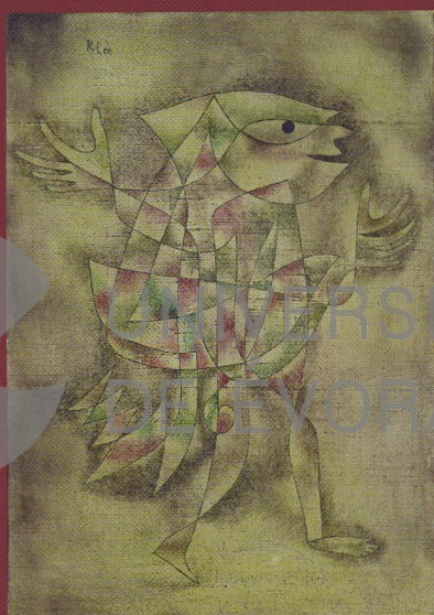
Paul Klee. Narr in Trance , 1929 Óleo sobre lienzo. 50,5 x 35,5 cm Museum Ludwig, Colonia

12 de noviembre de 2008 - 16 de febrero de 2009