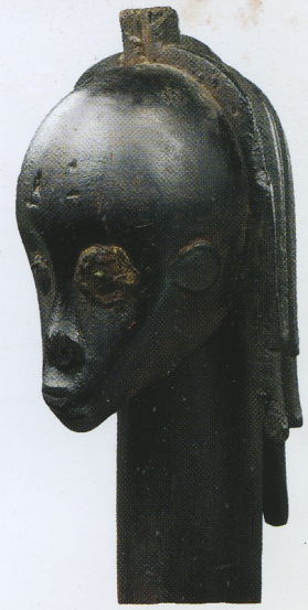
Artista de los Fang, Gabón. S. XIX Cabeza relicario nlo byeri. Madera, discos metálicos y pigmentos, 63 cm (altura) Musée Dapper, París (Inv. n° 2664)

En la exposición, que cuenta con secciones sobre Arte africano, Dadá, Verismo, Cubismo, Surrealismo y sobre el papel de las artes en la Guerra Civil española, se reúnen por primera vez alrededor de cuarenta obras africanas originales, prestadas por prestigiosas colecciones internacionales públicas y privadas, que se reprodujeron en su famoso Negerplastik de 1915. En las secciones dedicadas a las vanguardias se exponen importantes obras de artistas como George Grosz, Rudolf Schlichter, Max Beckmann, Otto Dix, Pablo Picasso, Georges Braque, Juan Gris, Fernand Léger, André Masson, Joan Miró, Gaston-Louis Roux, Salvador Dalí, Hans Arp y Paul Klee.