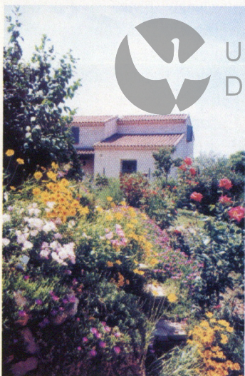
Photos exposées chez nos partenaires