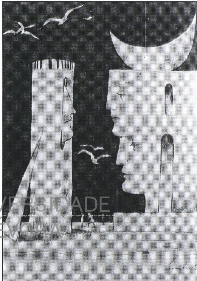
"A lua é assim..."

Alfragide, 28/3/1993 (In "Poemas com mimetismo")