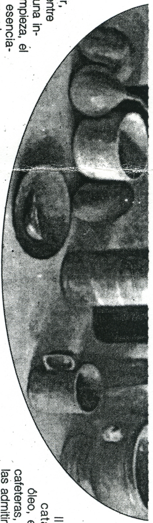
«Bodegón ovalado» (44,5 x 68). Óleo sobre madera

Esta declaración de amor tan públicamente hecha ha sido provo- cada por la contemplación, en su tercera exposición individual, de los cuadros de Juliet Pomés. Ha sido inevitable para mí evocar al maestro, intentando no caer en el