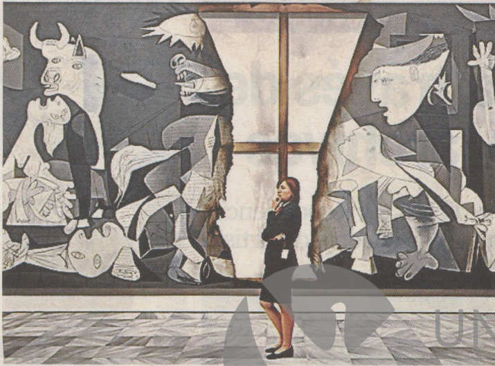
OBRA de Kepa Garraza. Acción de Asalto al Arte Nº19, Madrid, 2010. Óleo sobre lienzo

'Poéticas de destrucción' podrá visitarse en la sala hasta el próximo 21 de mayo // Se trata de un diálogo a partir de dos visiones diferentes