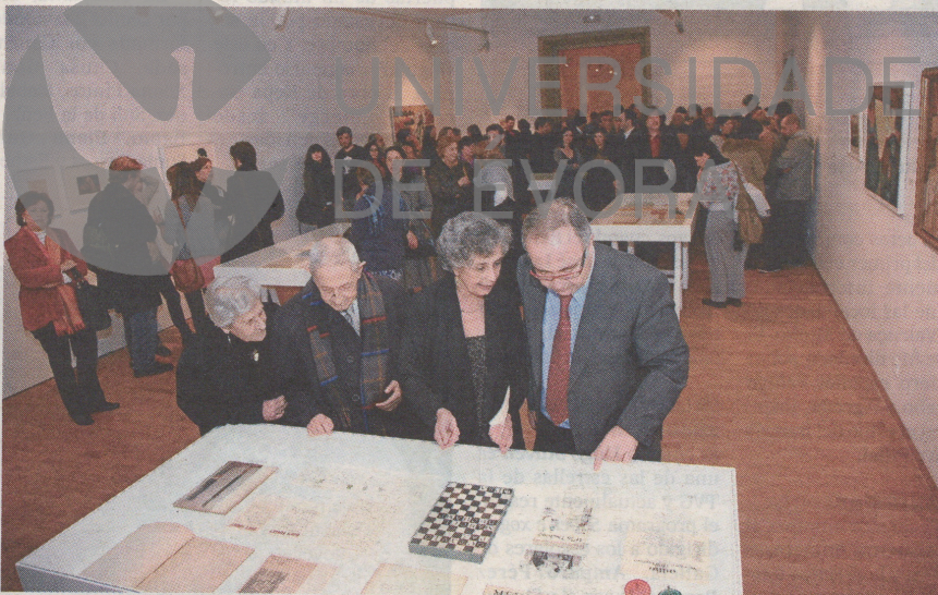
INAUGURACIÓN de la nueva muestra de la biblioteca y archivos de Eugenio Granell.