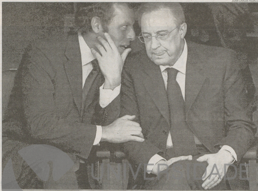
Sandro Rosell, á esquerda, e Florentino Pérez, compartindo confidencias nun recente partido entre os seus equipos

Pola súa banda, Ángel María Villar, presidente da Real Federación Española de Fútbol, esquívou onte as preguntas sobre os controis: "Non contesto. Igual que vostedes teñen